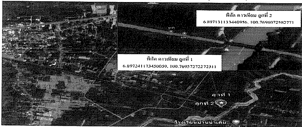
ภาพถ่ายมุมสูงจากอากาศยานไร้คนขับ แสดงจุดระเบิดทั้ง ๒ จุด